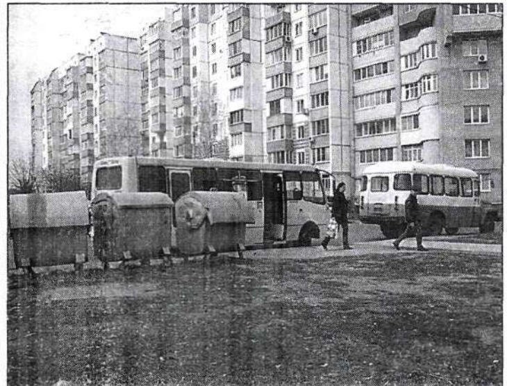
Стан пішохідної зони на вулиці Академіка Линника сьогодні