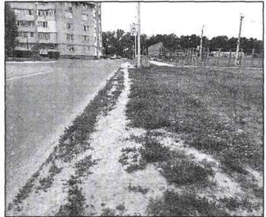
Стан пішохідної зони на вулиці Академіка Линника сьогодні